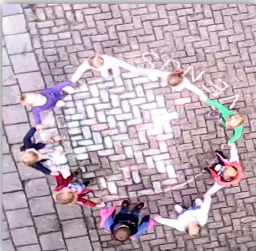
Uitbeelden van ons zonnestelsel op het plein, gefotografeerd met een drone