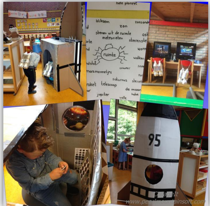
Werken aan het project Het Heelal in groep 1 en 2

De vakken taal en begrijpend lezen bieden wij in samenhang met het thema aan. Dit doen wij door bijv. teksten voor begrijpend lezen aan te bieden die bij het thema passen.