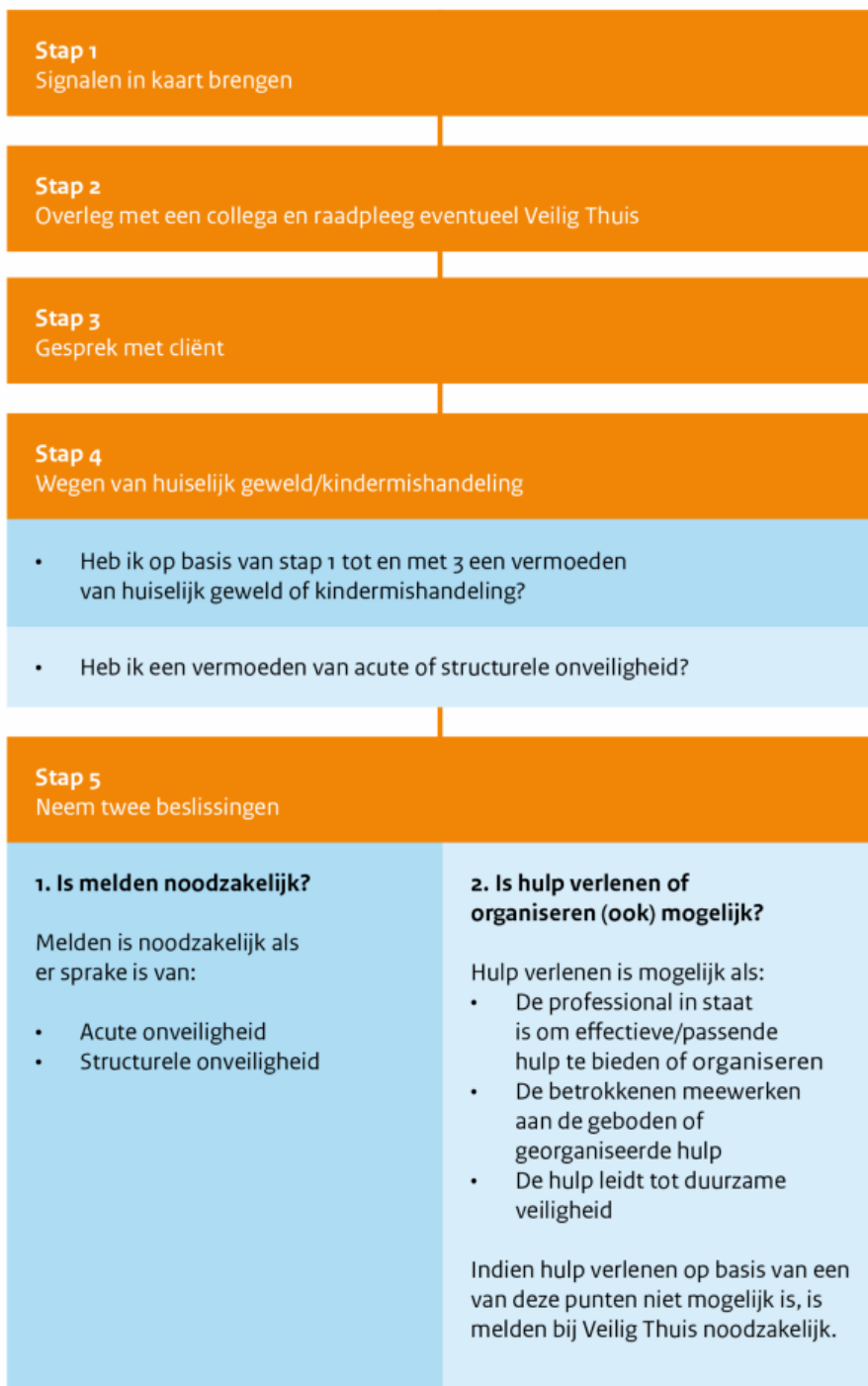
Figuur 1: Stappenplan verbeterde meldcode