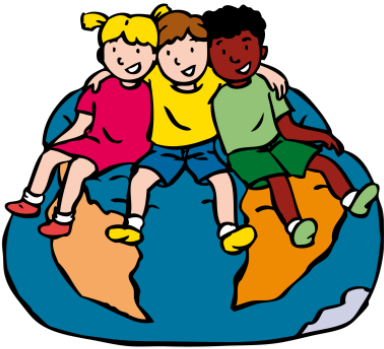
We horen bij elkaar

Op de Tjongerschool werken we met het programma De Vreedzame School. Dit is een programma voor sociale competentie en democratisch burgerschap. Kinderen leren met elkaar beslissingen te nemen, conflicten op te lossen, verantwoordelijkheid nemen voor elkaar en de gemeenschap en een open houding aan te nemen tegenover verschillen tussen mensen.