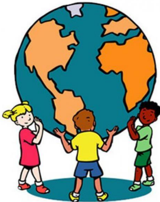
De Vreedzame School